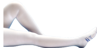
Witte dijlgte kousen met gesloten teen