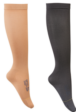
Beige en zwarte knielengte kousen met gesloten teen